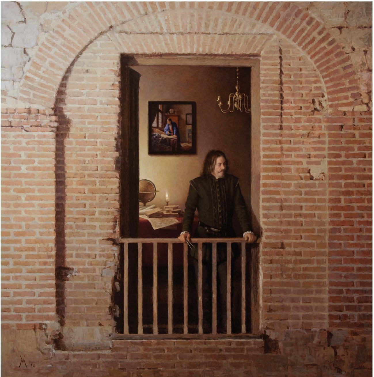
The Geographers , 2010. Oil on canvas mounted on panel, 59 x 59 in. © Guillermo Muñoz Vera, courtesy of Forum Gallery, New York. Óleo sobre lienzo montado sobre panel de madera, 150 x 150 cm. © Guillermo Muñoz Vera, courtesy of Forum Gallery, New York.