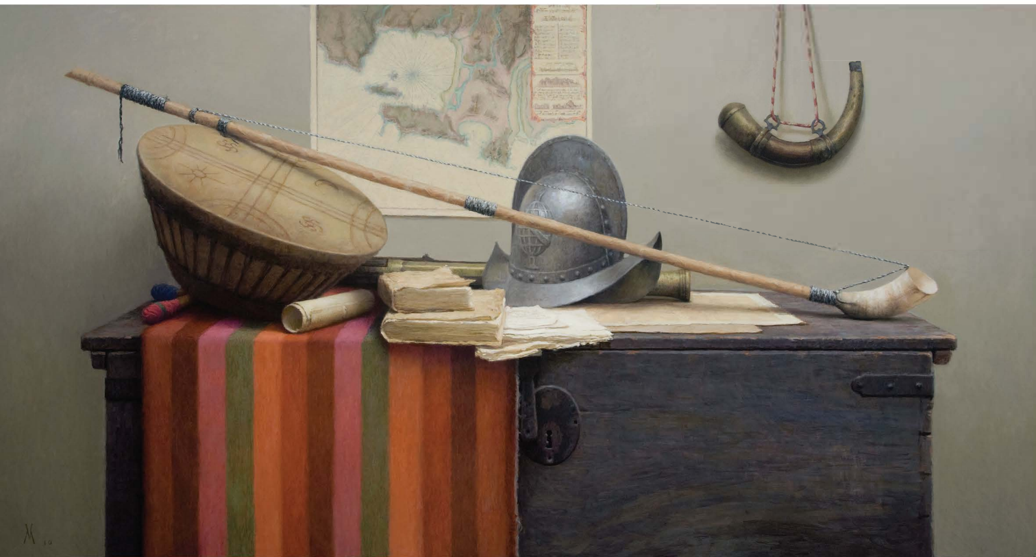
Colonial Still Life in Araucania, 2010. Oil on canvas mounted on panel, 33 1/8 x 48 in.

© Guillermo Muñoz Vera, courtesy of Forum Gallery, New York.