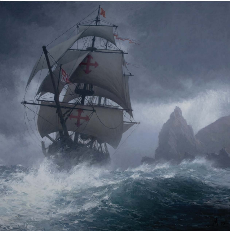
Cape Horn , 2010. Oil on canvas mounted on panel, 59 x 59 in. © Guillermo Muñoz Vera, courtesy of Forum Gallery, New York. Óleo sobre lienzo montado sobre panel de madera, 150 x 150 cm. © Guillermo Muñoz Vera, courtesy of Forum Gallery, New York.