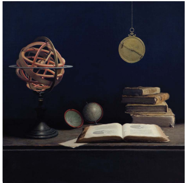
Sidereus Nucus , 2010. Oil on canvas mounted on panel, 35 1/4 x 35 1/4 in. © Guillermo Muñoz Vera, courtesy of Forum Gallery, New York. Óleo sobre lienzo montado sobre panel de madera, 89,5 x 89,5 cm. © Guillermo Muñoz Vera, courtesy of Forum Gallery, New York.